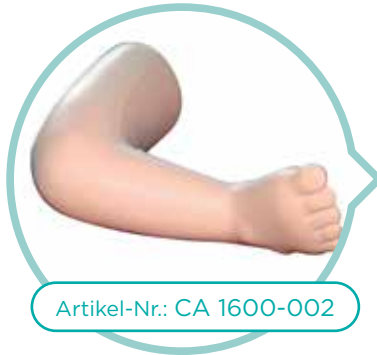
Artikel-Nr.: CA 1600-002