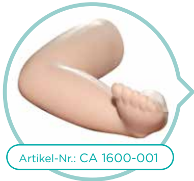
Artikel-Nr.: CA 1600-001